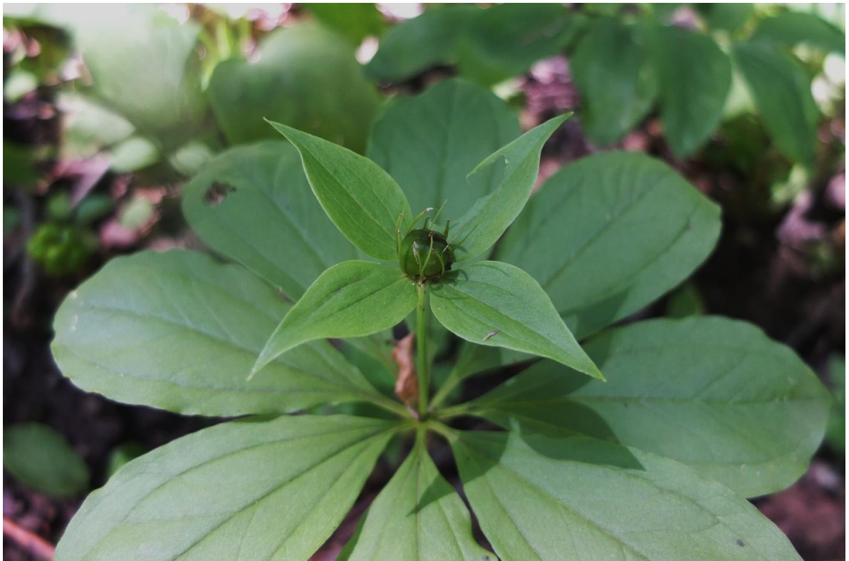
Рис. 4 – Вороний глаз неполный