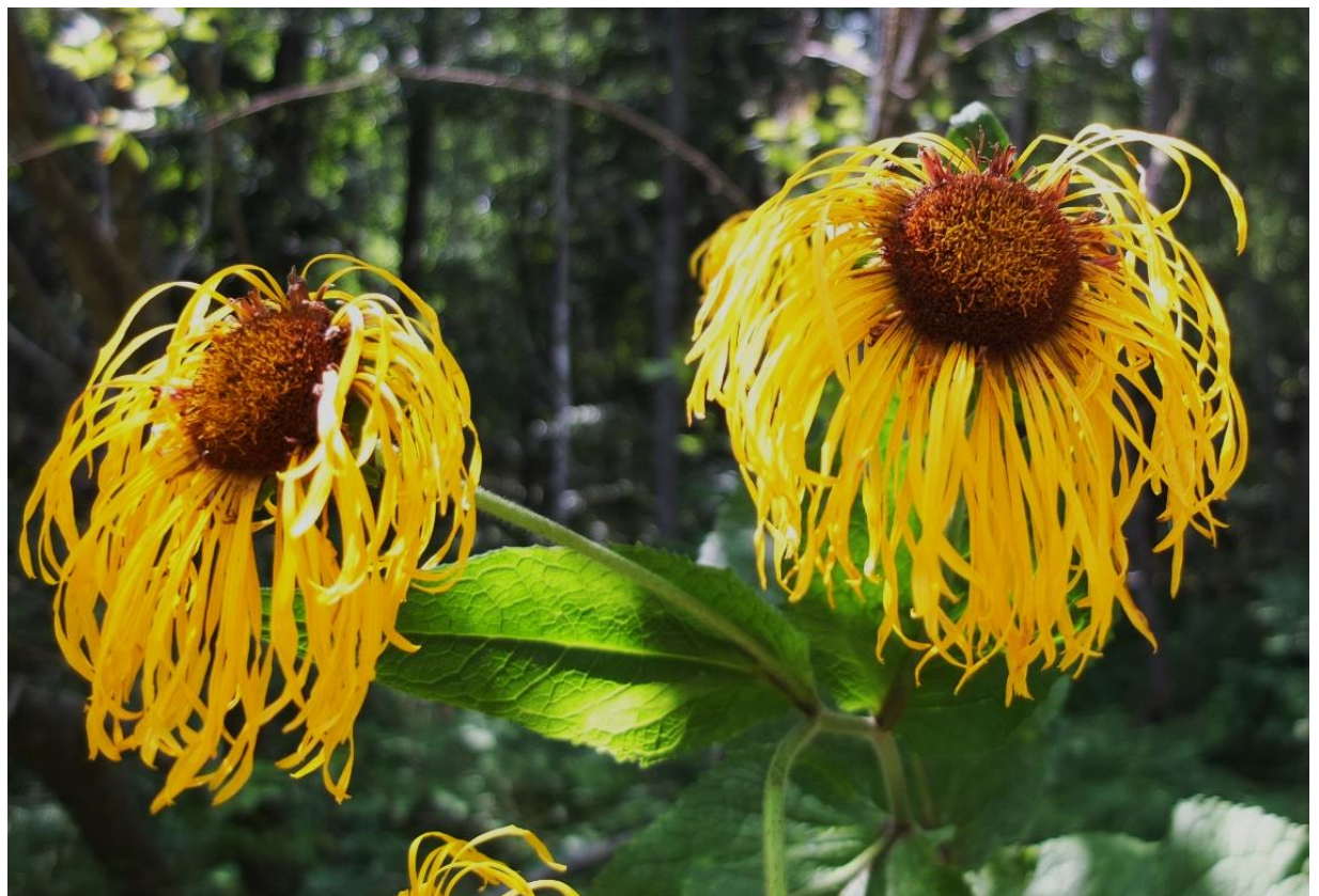
Рис. 3 – Телекия красивейшая