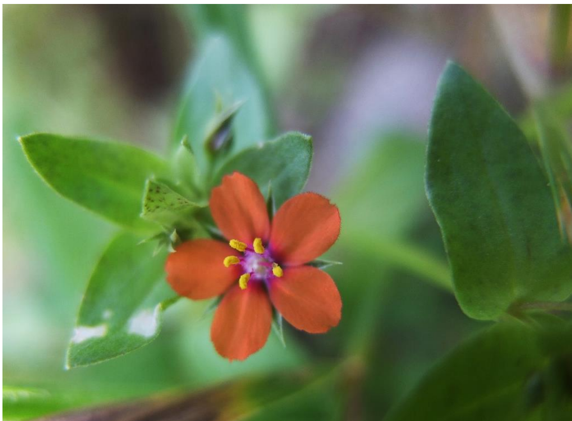
Рис. 18 – Очный цвет полевой