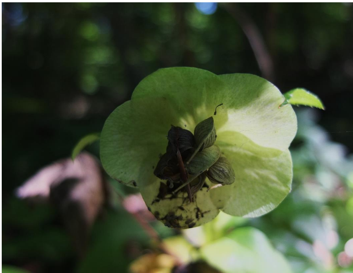
Рис. 8 – Морозник кавказский