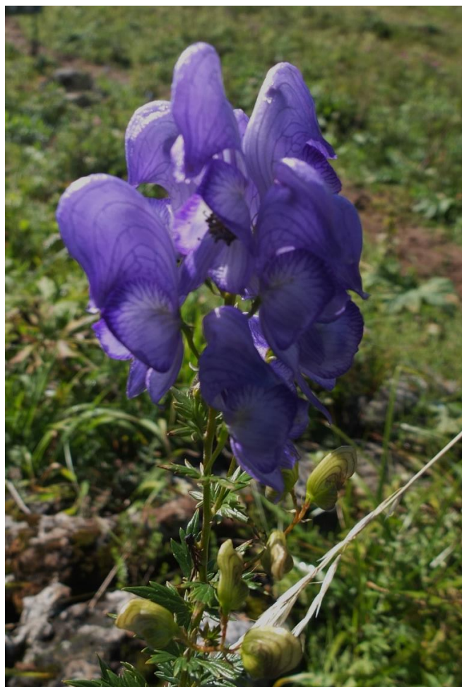
Рис. 1 – Борец носатый