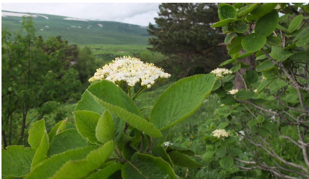
Рис. 2 – Калина гордовина