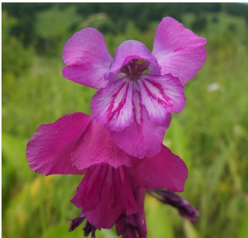
Рис. 10 – Шпажник черепитчатый