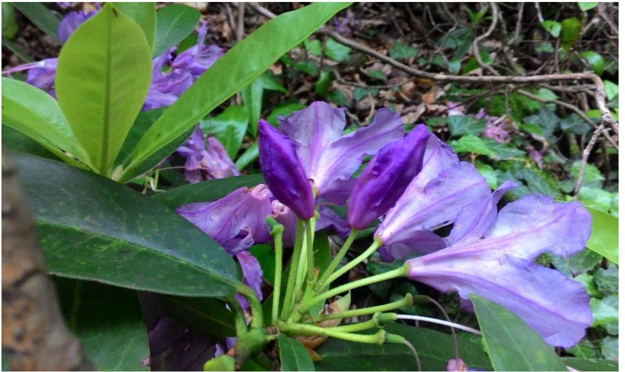
Рис. 2 – Рододендрон понтийский