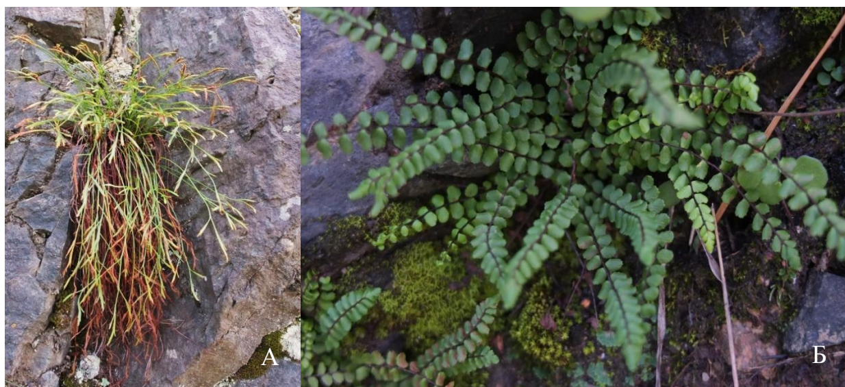
Рис. 9 – Костенцы: А – костенец северный Б – костенец волосовидный