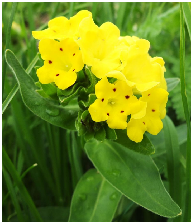
Рис. 14 – Гуния красивая