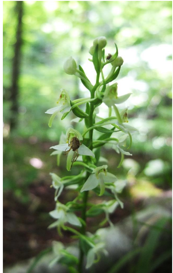
Рис. 6 – Любка двулистная