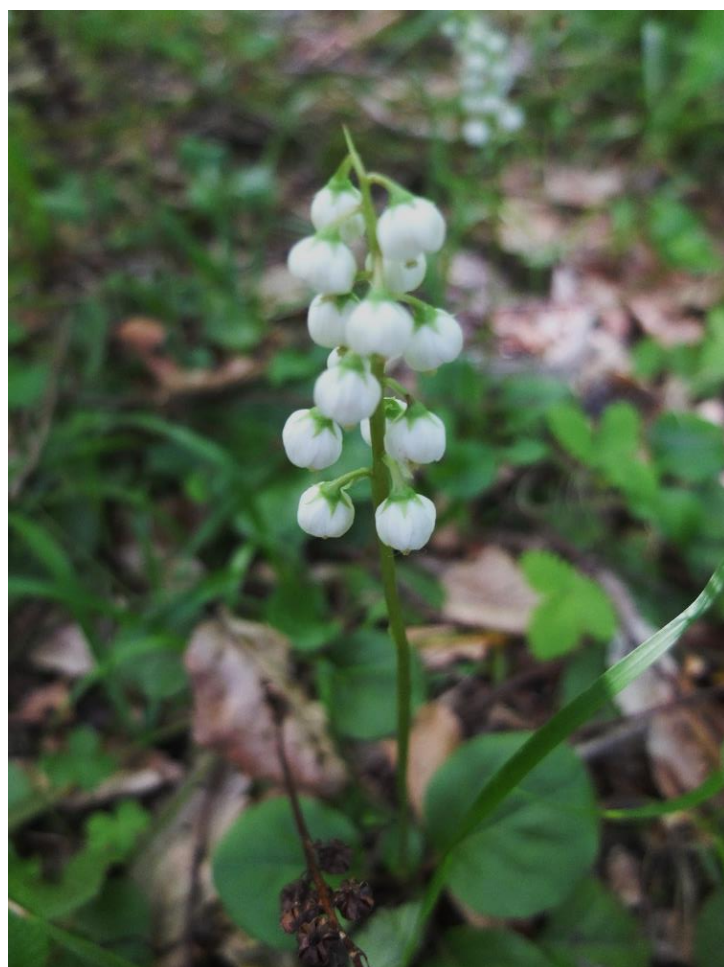
Рис. 15 – Грушанка круглолистная