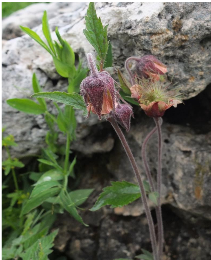
Рис. 11 – Гравилат речной