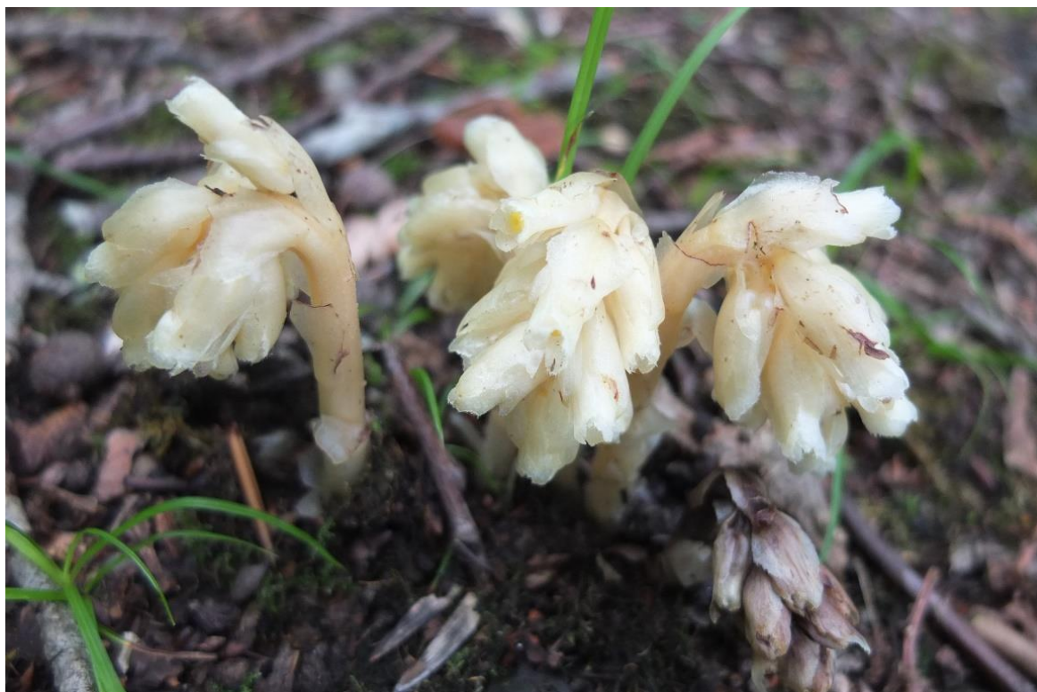
Рис. 19 – Петров крест чешуйчатый