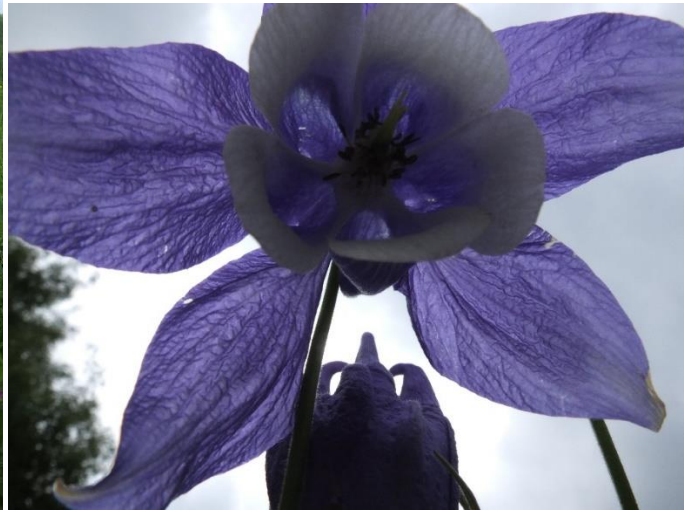
Рис. 12 – Водосбор олимпийский