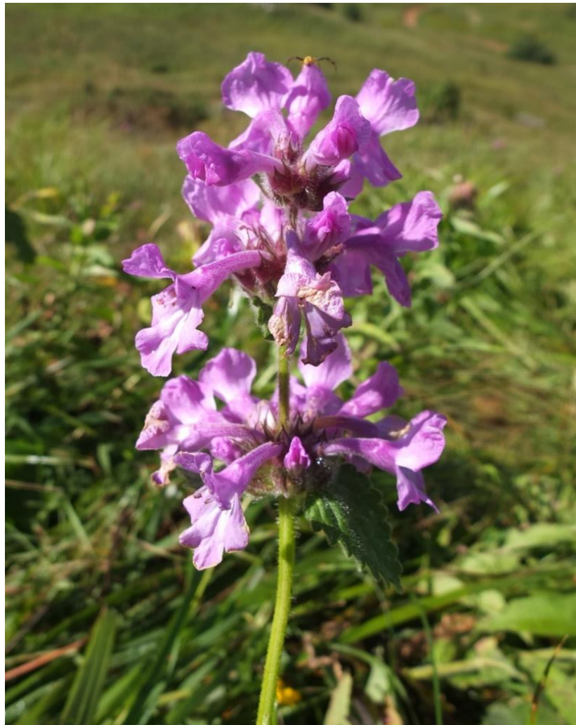
Рис. 17 – Буквица крупноцветковая