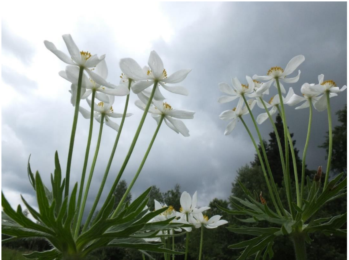
Рис. 13 – Ветреница пучковатая