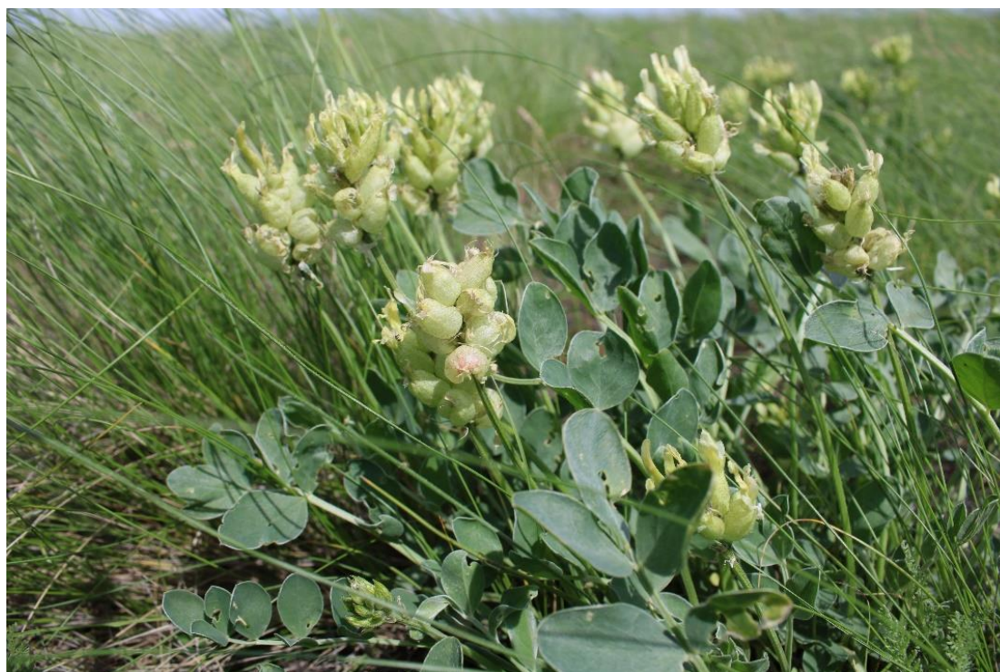
Рис. 1 – Astragalus calycinus в балке Сибиречной (Дубовский р-н)

Astragalus calycinus – астрагал чашечный (рис. 1) – кавказский вид, ксеротермический реликт (Белоус, 2013), включённый в ККРО (2014) с категорией статуса редкости 3г как редкий вид, имеющий значительный ареал, но находящийся в РО на северной границе ареала. Астрагал чашечный включался в списки редких, исчезающих и нуждающихся в охране растений РО с 1977 г. (Зозулин и др., 1977). Региональный критерий редкости (РКР) – В, который подчёркивает естественную редкость вида на протяжении всего ареала по биологическим, экологическим и историческим причинам, его уникальность как для России и сопредельных стран, так и для РО.