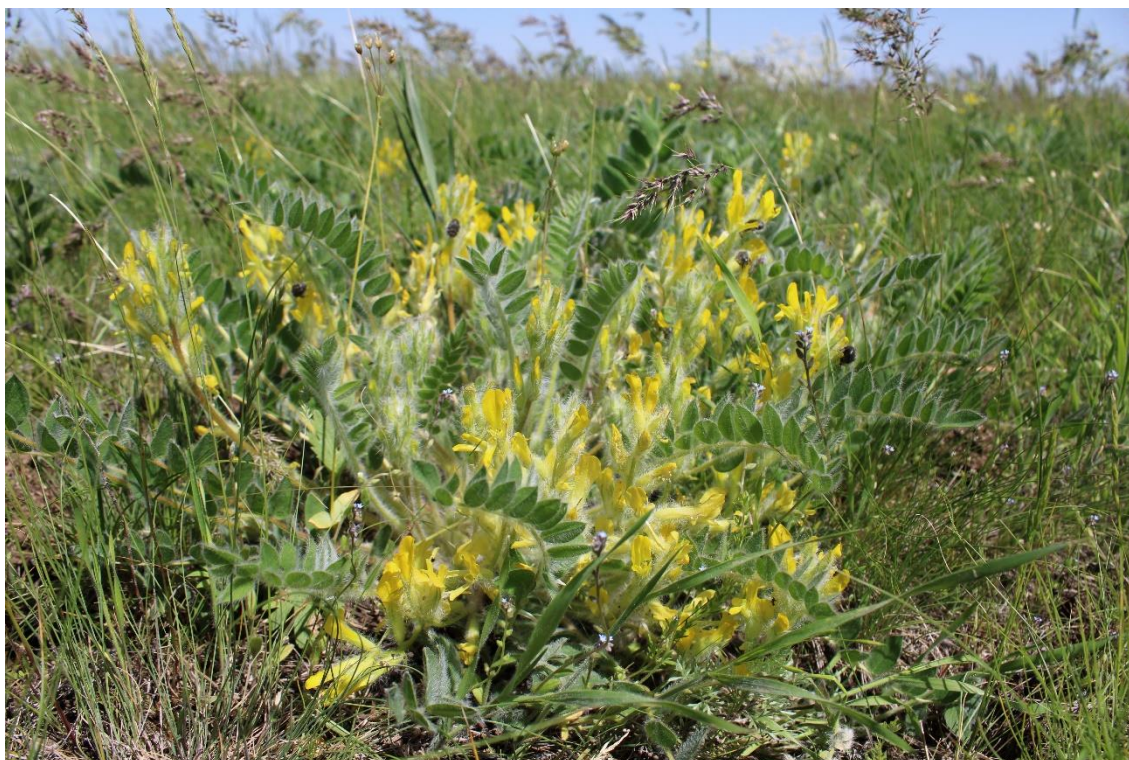
Рис. 2 – Astragalus pubiflorus на склонах балки Курячьей (Зимовниковский р-н)

Екатериновка, б. Горькая), Орловском (пос. Орловский, в 12–15 км к востоку и северо-востоку; пос. Волочаевский), Пролетарском (х. Коврино, б. Большая Бургуста), Ремонтненском (х. Весёлый, б. Бирючья; пос. Привольный, б. Улан), Родионово-Несветайском (х. Болдыревка; сл. Алексеево-Тузловка), Сальском (пос. Тальники, б. Сухая Кугульта; х. Загорье, б. Правая Юла), Целинском (севернее пос. Вороново) и Шолоховском (х. Дубровский) р-нах (Кузьменко и др., 2015; Ермолаева и др., 2021).