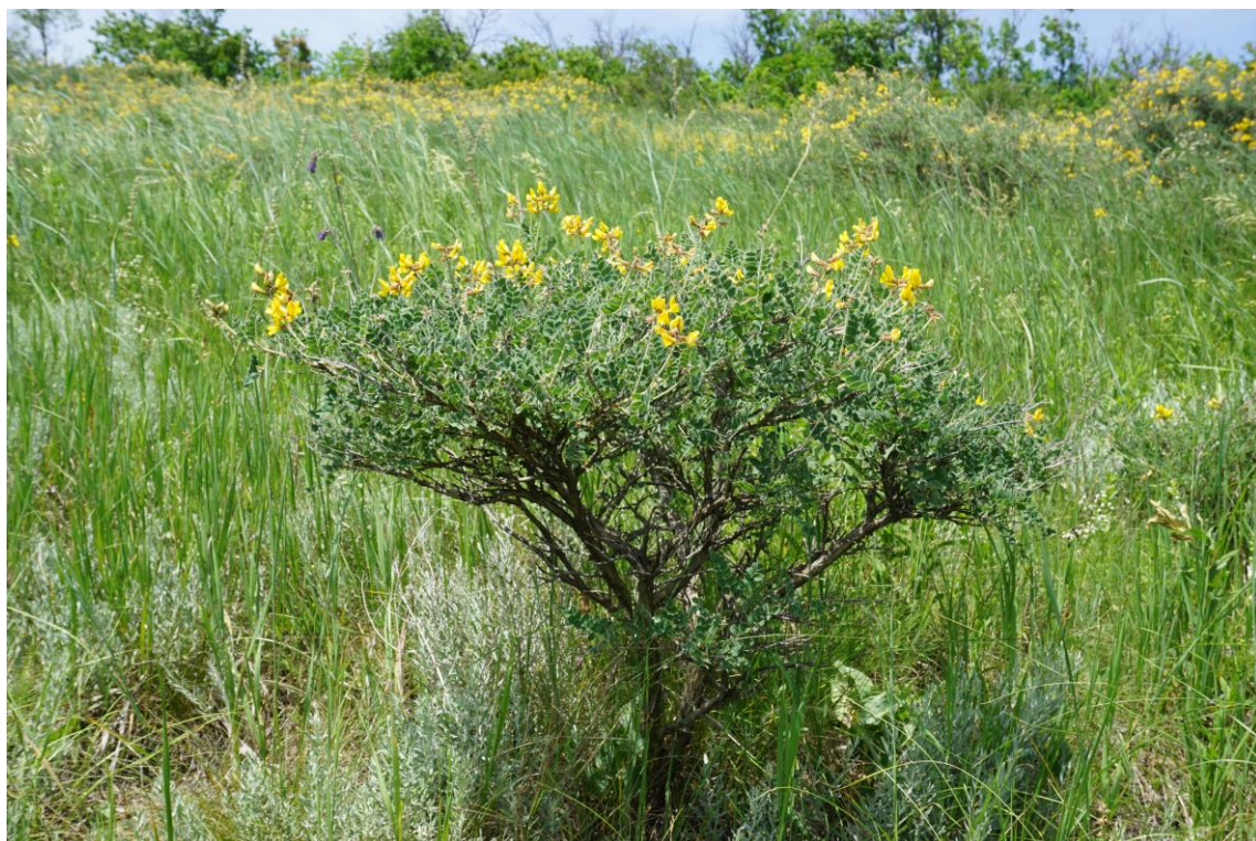
Рис. 4 – Calophaca wolgarica на ООПТ «Раздорские склоны» (Усть-Донецкий р-н)

В РО Calophaca wolgarica характерен для целинных зональных и каменистых сухих разнотравно-дерновиннозлаковых, дерновиннозлаковых степей, понижений среди полынно-дерновиннозлаковых степей, а также сформированных тимьянников кальцепетрофитной серии. В современных условиях нередко растёт в незональных позициях на склонах балок и речных долин в степных сообществах, на смытых глинистых и щебенчатых склонах, опушках байрачных кустарников.