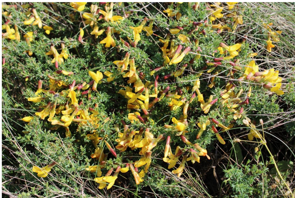
Рис. 5 – Caragana scythica на склонах балки Глубокой (Мартыновский р-н)

Ценотически Caragana scythica приурочена к выходам каменистых карбонатных пород и глин, каменистым степям и зональным разнотравно-дерновиннозлаковым степям на высококарбонатных и скелетных почвах. По типу жизненных форм карагана скифская принадлежит к низкорослым геоксильным (древесно-корневищным) степным кустарникам, во взрослом состоянии образующим клоны (куртины) из сложной системы парциальных кустов, отдалённых друг от друга на 20–45 см (Купрюшина, 2007). В связи с этим при учётах численности популяций за основу берётся отдельный парциальный куст.