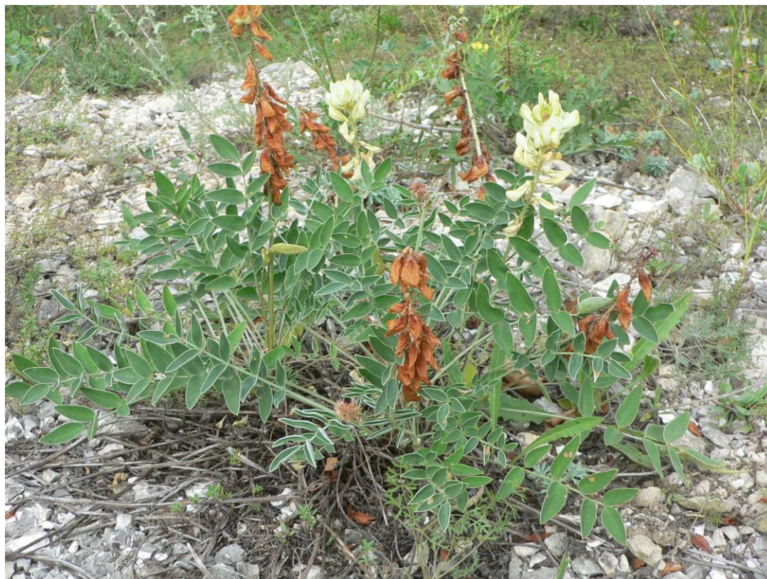
Рис. 6 – Hedysarum grandiflorum на ООПТ «Лысогорка» (Куйбышевский р-н)

Ценотически копеечник крупноцветковый приурочен к обнажениям мела и мергеля, реже встречается на известняках и песчаниках; в РО произрастает в пионерных группировках и тимьянниках на щебенчатых скелетных почвах, в каменистых степях на участках с разреженным травостоем, так как низкоконтурноспособен.