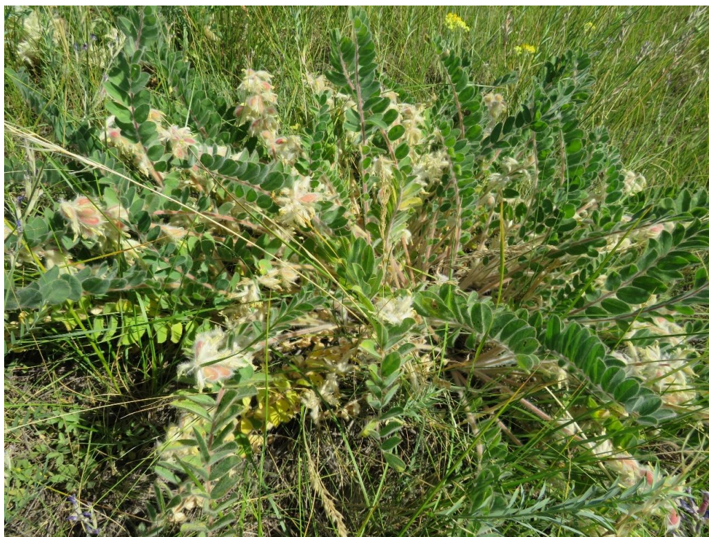
Рис. 3 – Astragalus tanaiticus в окрест. х. Романова (Белокалитвинский р-н)

Основной ареал астрагала донского находится в РФ, в Донецкой и Луганской народных республиках и на Украине (Днепропетровская и Харьковская обл.). В России вид встречается преимущественно в Волгоградской обл. (Сагалаев, 2017) и РО, указывался для Пензенской обл. (по Хопру), в последние годы отмечен также в Воронежской обл. (Григорьевская и др., 2018).