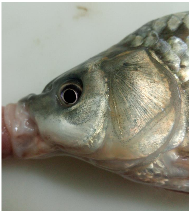
Рис. 2 Экземпляр гибридной формы (без усиков), пойман в августе 2020 г. в Свином гирле р. Дон. Карпокарась - гибрид карася и карпа.

Фенотип карпокарасья ближе к карпу, а по окрасу и форме чешуи похож на карася (Рис. 3). Такие гибриды возникают при скрещивании ♀ карпа и ♂ серебряного карася.