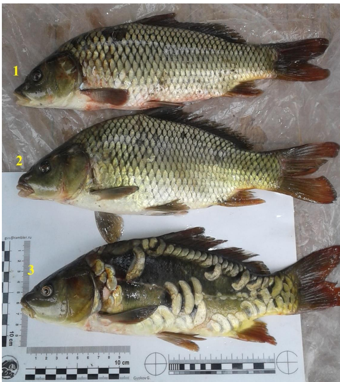
Рис. 1. Разные формы карповых рыб из одного улова в восточной части Таганрогского залива. 1- Сазан - Cyprinus carpio , Linnaeus, 1758. 2- Карп— Cyprinus carpio carpio (одомашненная форма сазана). 3- Зеркальный карп - Cyprinus rex cyprinorum .

Необходимо отметить, что собранные данные показали - в выборке сазана преобладали самцы 65,25 %, самки составляли 33,75 %. Икрометание начиналось в середине мая и продолжалось до середины июля. Данные по средней длине и массе рыб представлены в таблице №1.