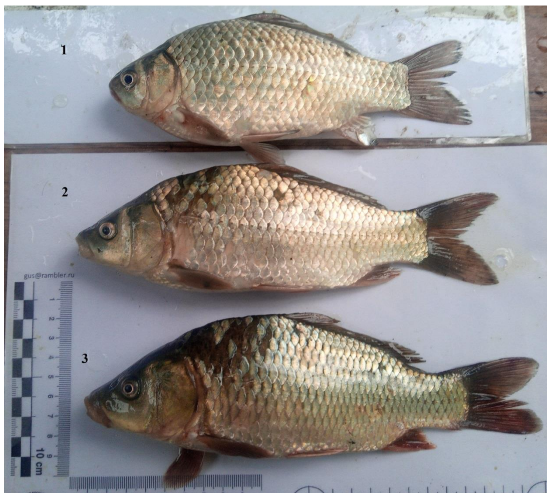
Рис. 3. 1-Серебряный карась Carassius gibelio (Bloch, 1782) 2- Карпокарась - гибрид карася и карпа. 3- Сазан (карп) Cyprinus carpio Linnaeus, 1758. Все рыбы взяты из одной ставки сетей в Свином гирле р. Дон.

Уловы этой гибридной формы в августе-сентябре 2020 г. в Свином гирле р. Дон достигали 80 % от общего улова на жаберные сети ячейёй 40 мм.