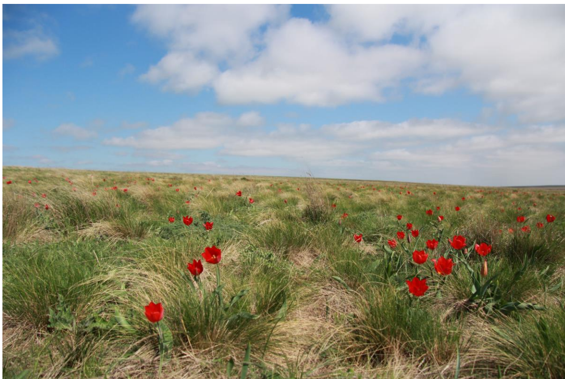
Рис. 3 – Tulipa schrenkii

Calophaca wolgarica (L. fil.) Fisch. ex DC. (рис. 4) – растет в северной части участка. На сопредельных территориях не встречен, так как была проведена распашка на его местообитаниях.