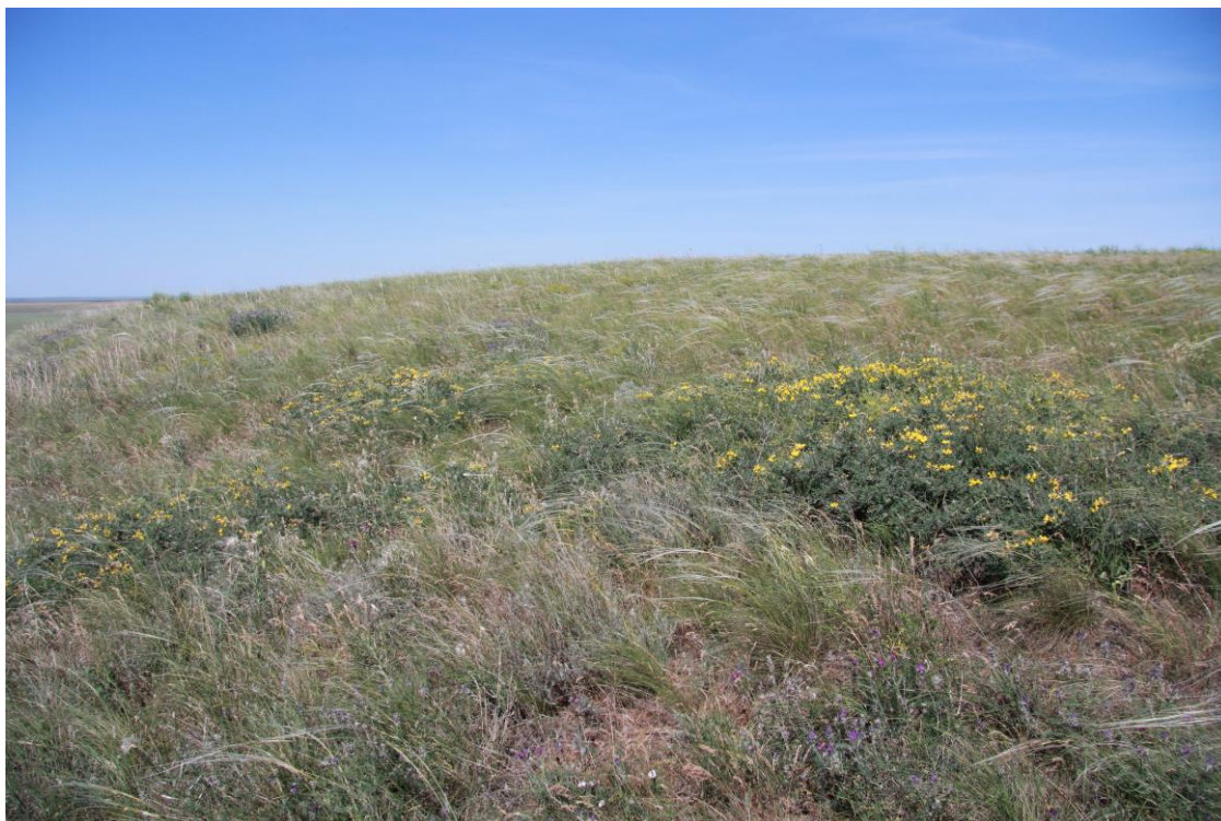
Рис. 4 – Calophaca wolgarica на Стариковском участке

Calophaca wolgarica (L. fil.) Fisch. ex DC. (рис. 4) – растет в северной части участка. На сопредельных территориях не встречен, так как была проведена распашка на его местообитаниях.