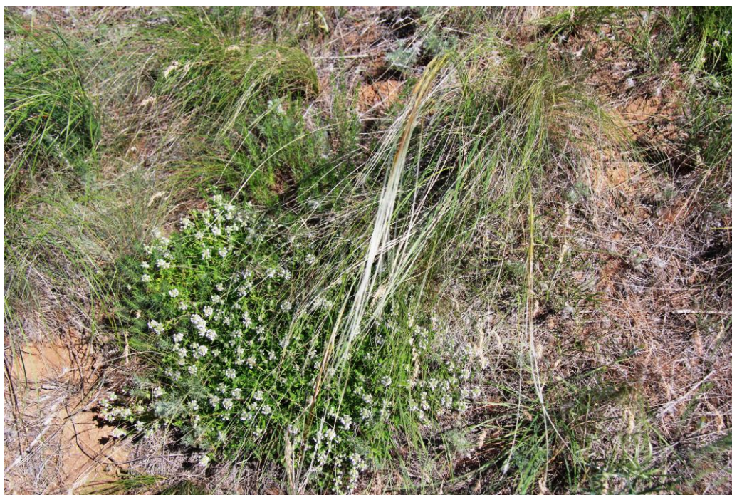
Рис. 2 – Stipa zalesskii

Stipa zalesskii Wilenskiy (рис. 2) был обнаружен в процессе геоботанических описаний, в западной части. Это травянистый дерновинный многолетник. Еврикерофит. Очень редко. На сопредельной территории Stipa zalesskii Wilenskiy обнаружен не был.