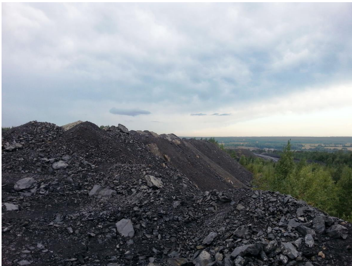
Рис. 1. Первый участок Горловского угольного бассейна.

Месторождение расположено на правом берегу р. Обь в административных границах Новосибирской области в 100 км к югу от Новосибирска, в Искитимском районе (рис. 2). Разработчик – компания «Сибирский Антрацит». Угленосная толща мощностью 640–940 м содержит до 55 пластов и пропластков угля (мощность отдельных пластов от 10–14 до 26–41 м), вытянута полосой в северо-восточном направлении на 120 км при средней ширине 1,5–7,5 км. Прогнозные запасы до глубины 900 м оценены в 6,5 млрд. т. Таким образом, угольный бассейн характеризуется повышенной угленасыщенностью. Угли представлены антрацитами и отличаются высоким качеством: малозольные, малосернистые, высокоуглеродистые, с низким удельным электросопротивлением, высокой механической прочностью и термической стойкостью.