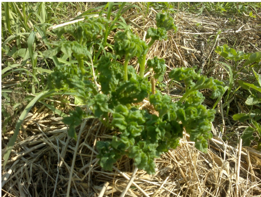
Рис. 4 Недоразвитость растений (ориг., 2016 г.)

Основные очаги фиксируются в Приволжском, Харабалинском, Черноярском, Лиманском районах, единичные случаи проявления вирусных заболеваний встречаются в Красноярском и Наримановском районах. Наличие симптомов вирусоносительства в частном секторе фиксируется повсеместно (табл. 2).