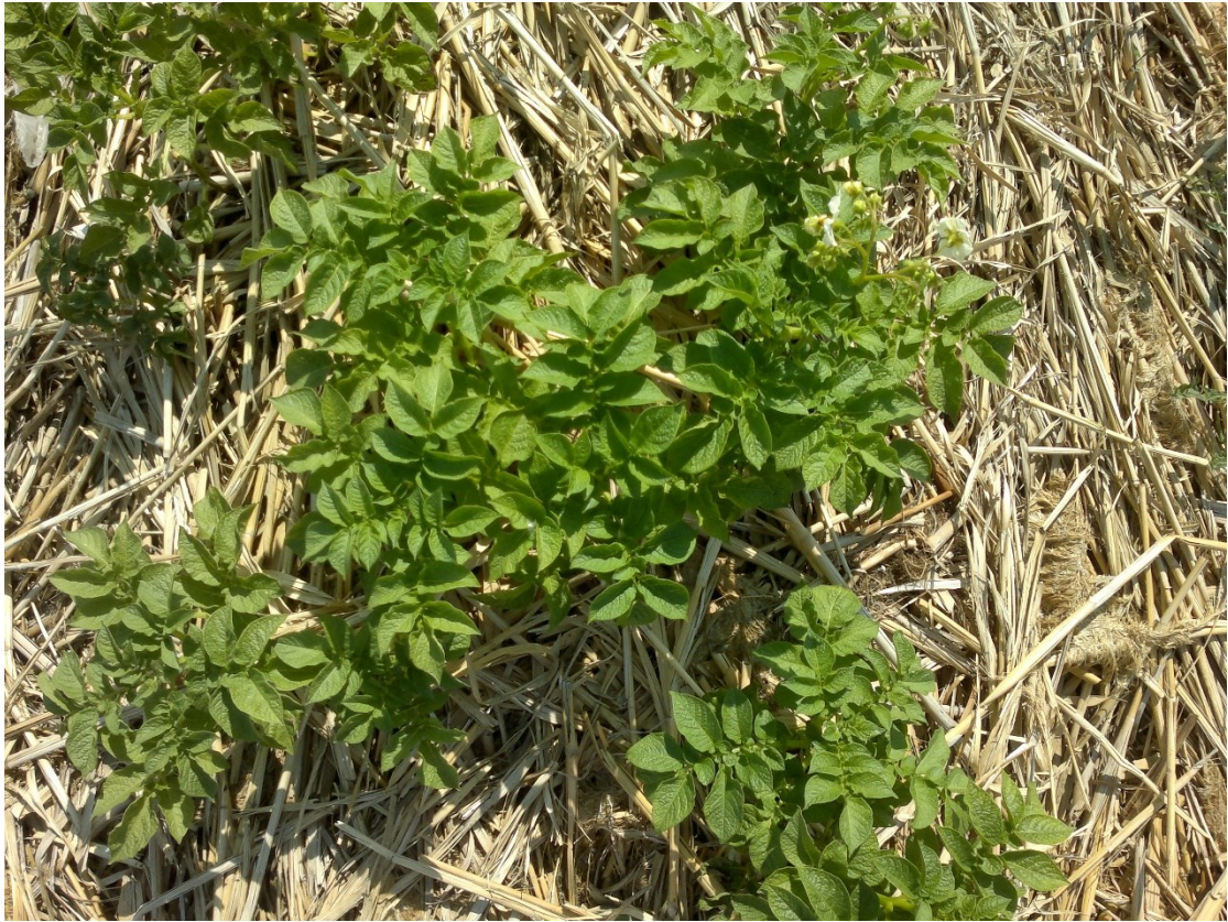
Рис. 3 Морщинистость и деформация листьев (ориг., 2016 г.)