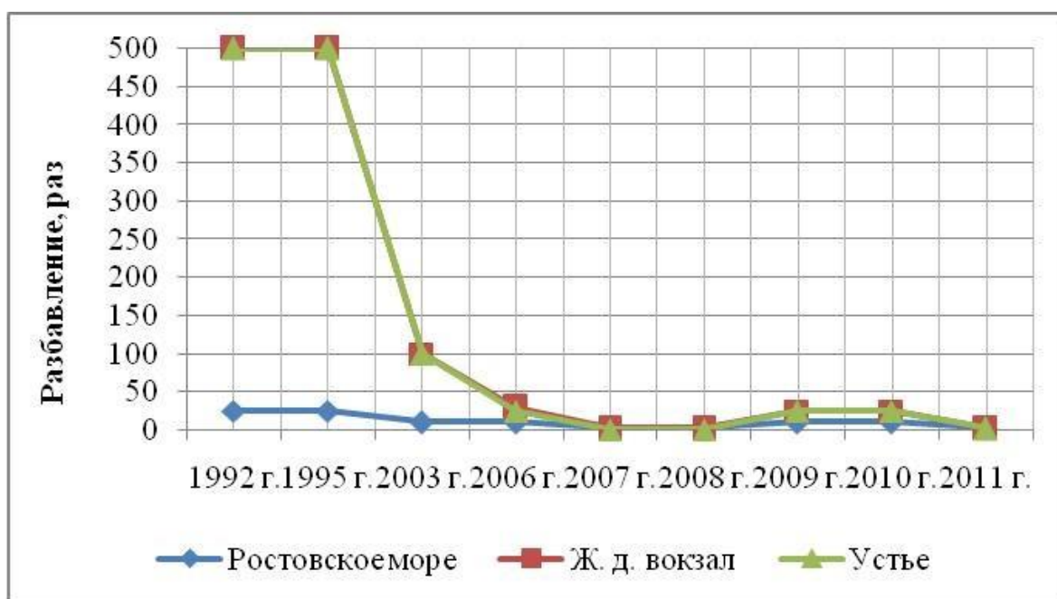
Рисунок 1 - Снижение токсичности вод реки Темерник (при разбавлении)

Пробы вод в районе железнодорожного вокзала и устья реки проявляли большее негативное действие и были отнесены к 4—5 классам токсичности и квалифицировались как чрезвычайно и весьма токсичные, а экологический статус — поли- и гипертоксичный, т.е. воды практически являлись сточными [4]. Снижение токсичности природных вод реки Темерник по показателю гибели Daphnia magna происходило при разбавлении в 500 раз (рисунок 1).