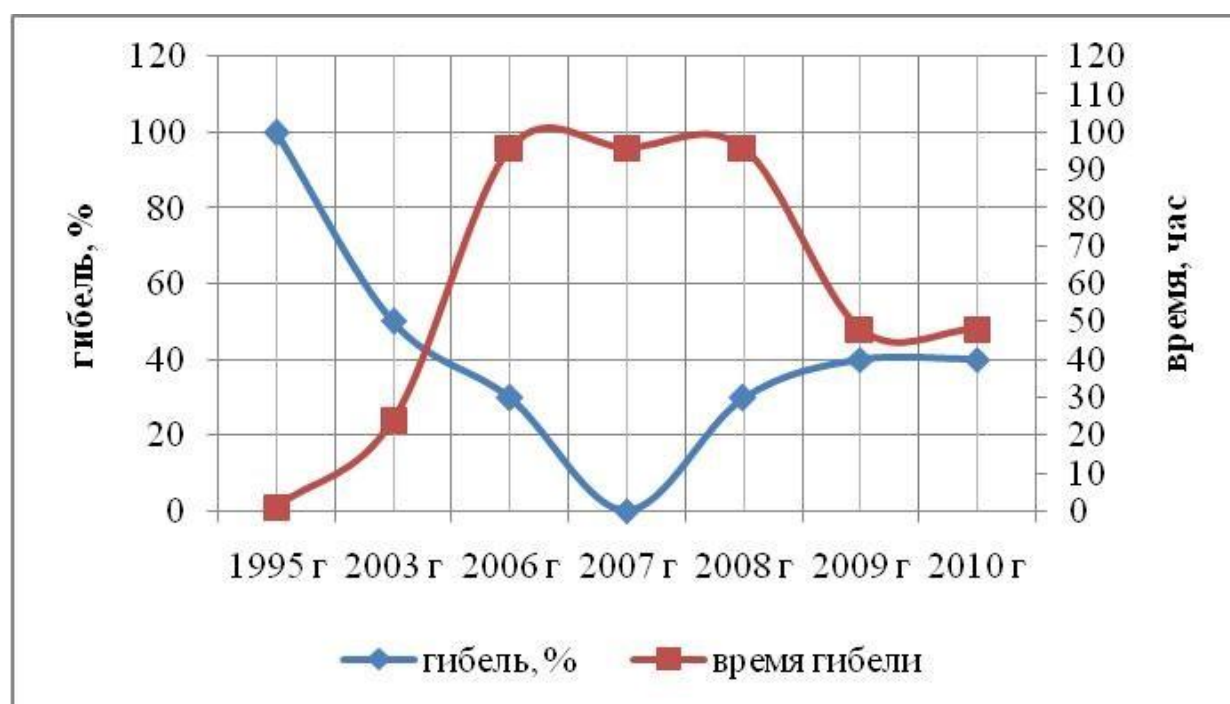
Рисунок 3 - Результаты биотестирования вод р. Дон после впадения р. Темерник по гибели Daphnia magna

Динамика токсичности вод устья реки Темерник полностью совпала с токсичностью вод реки Дон в месте впадения реки Темерник (рис 3).