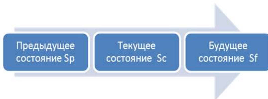
Рис. 1. Временная цепь состояний почвы

ЦКС, проявляющаяся в периодических изменениях количества тепла и влаги, поступающих в почву, приводит к колебаниям энергии почвообразовательных процессов [2]. Это, очевидно, влияет на колебания скорости почвообразовательных процессов, которые, по-видимому, должны приводить к характерной «порционности» почвообразования, связанной с ЦКС. В связи с этим, целью данного исследования является оценить изменения свойств почв за достаточно короткий (приблизительно 30 лет) интервал, в котором проявляются особенности ЦКС на юге Западной Сибири.